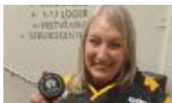
MARIKA TOG EMOT MATCHTRÖJAN SIDAN 3